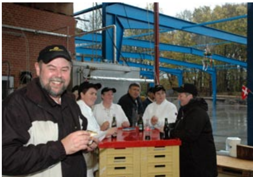
Første tilbygning på Endrup Andelsmejeri siden 1987 fejres på behørig vis. Det 1.200 m 2 store ostelager vil fordoble mejeriets samlede kapacitet.

“Vi går fra at producere som i 1930’erne og til noget, der minder om mejeribrug i 1950’erne,” lyder meldingen fra Peer Steen