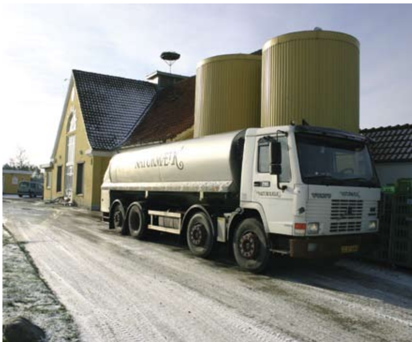
Naturmælk er et af de økologiske mejerier, som har vist interesse for at producere oste på basis af ensilagefri mælk.

"Der bliver argumenteret for, at ensilagefri mælk smager bedre, og at det kan retfærdiggøre en højere pris. Men det må vi se på. Drikkemælk kan måske