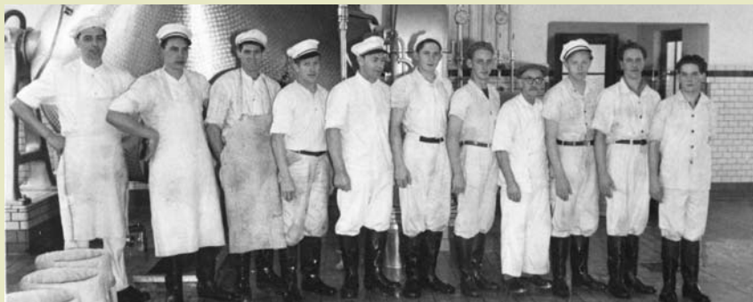
Stolte mejerister opstillet i kærnesalen på Brørup Mejeri i 1953. På de følgende sider i dette blad fortælles en del af historien om det store, sønderjyske mejeri