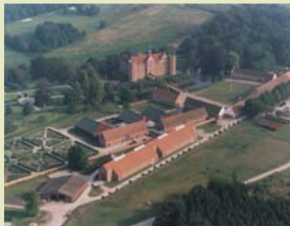
Landbrugsmuseet på Gammel Estrup

På Hjerl Hede Frilandsmuseum, midt i det vestjyske hedelandskab, arbejder der hver sommer mere end