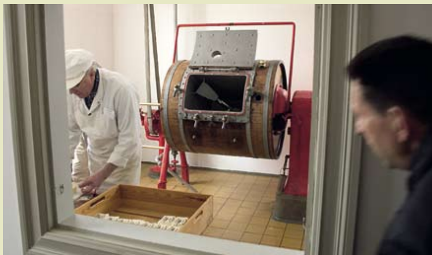
Med på en kigger. Omkring 54.000 gæster besøger hvert år Andelsbyen Nyvang, hvor man oplever arbejdslivet i et dansk landbysamfund i forrige århundrede. For eksempel på Søstrup Andelsmejeri fra 1929.