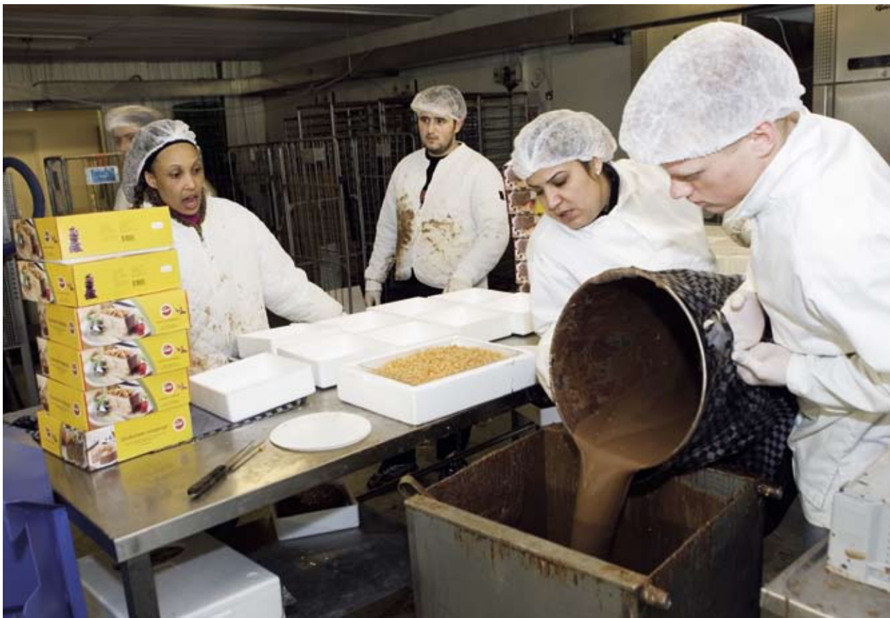
Chokolade skal der til. Medarbejderne på Is-Mejeriet i gang med dagens produktion af Cocio Islagkager.

Brand. Efter to års hårdt bearbejde lykkedes det en lille isproducent i Randers at få opfyldt sin drøm: At få lov til at fremstille en Cocio Chokoladeis.