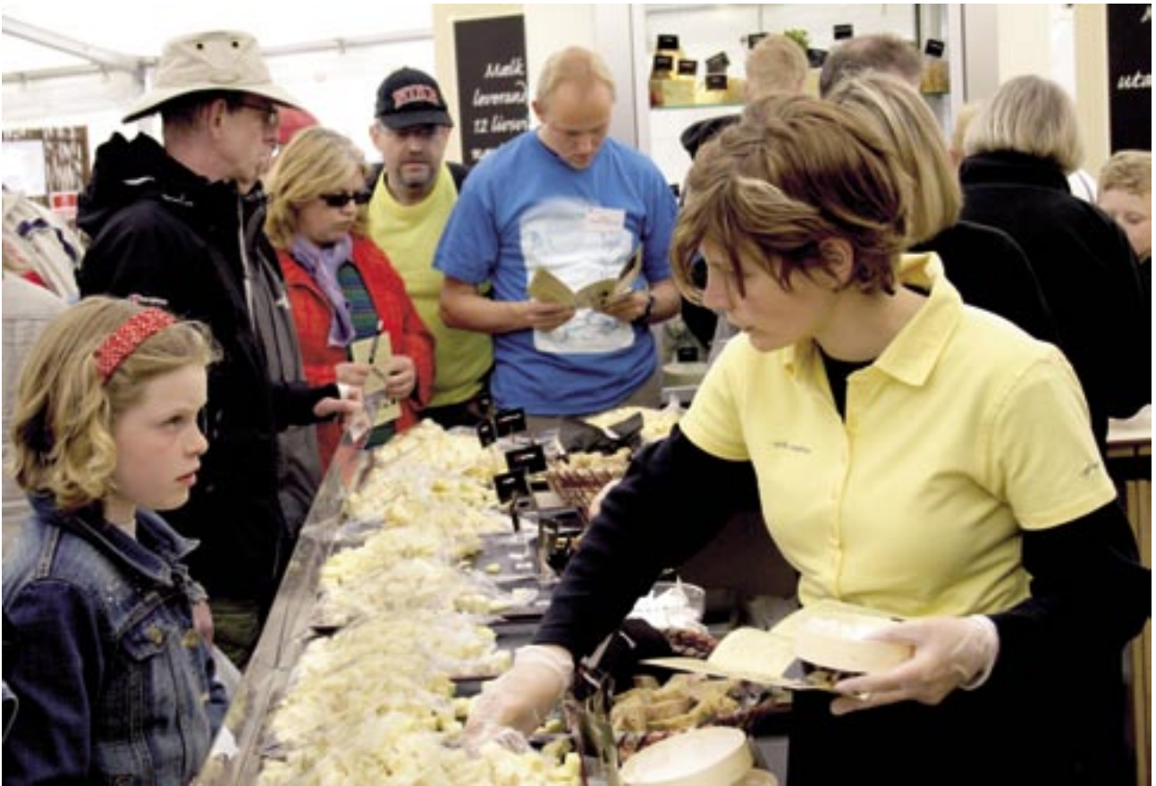
Hmmm, hvad skal man vælge: Der skal kun vælges tre ud af de 40 forskellige oste.