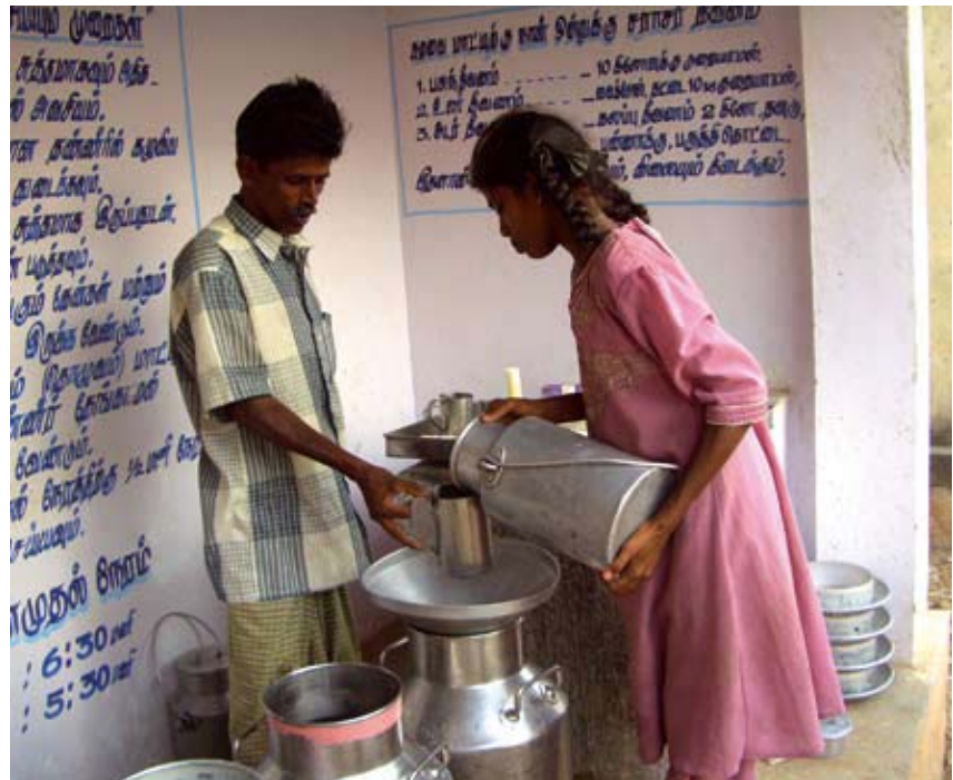
En ung pige indvejer dagens udbytte af mælk fra familiens kvæg i et kooperativ i landsbyen Kalingapatti i det sydlige Indien.