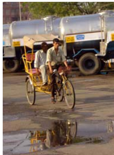
Tankbiler foran et af Mother Dairys anlæg.

Danmark har også en plads i historien om Indiens ‘hvide revolution’, som den markante stigning i mælkeproduktionen kaldes. Fra 1964 til 2004 blev der givet dansk støtte til i alt 25 forskellige projekter inden for husdyrsektoren.