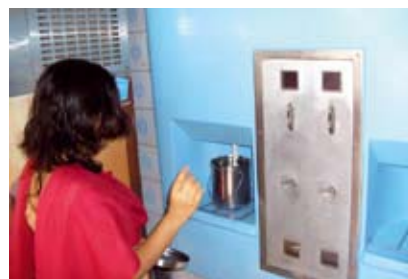
Automater, hvor forbrugerne i New Delhi selv tapper kold mælk, er blevet en stor succes for mejeriselskabet Mother Dairy.

Mother Dairy distribuerer mælken i tankbiler, der sammen med forretningerne og automaterne overvåges fra kontrolrum i mejeriet via trådløse sendere. Når en tankbil er ved at løbe tør for mælk, bliver den dirigeret tilbage til mejeriet for at blive tanket op, og når en automat er ved at løbe tør for mælk, bliver en tankbil dirigeret derhen.