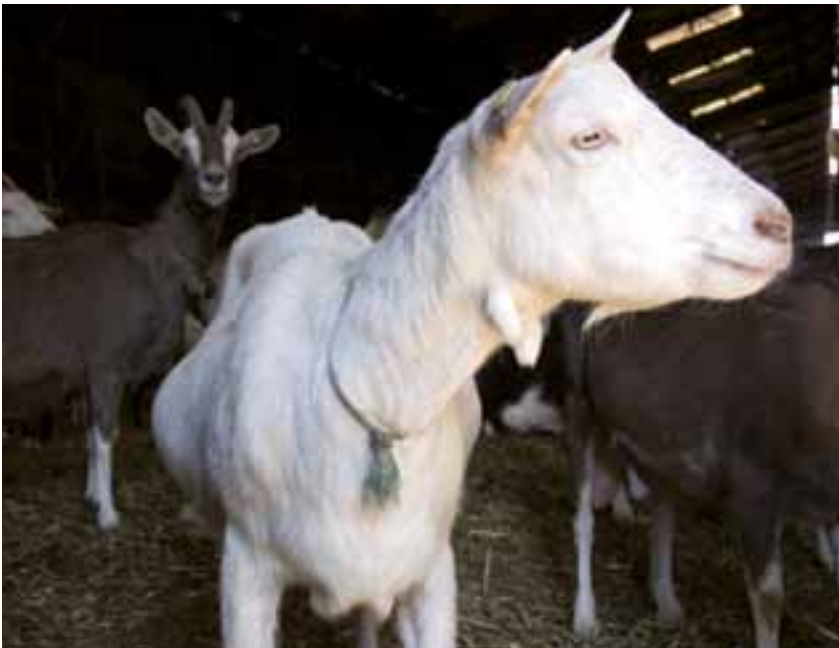
På Mejeriforeningens generalforsamling den 2. april blev der vedtaget en såkaldt udvidet fortolkning af begrebet mælk i organisationens vedtægter. Ændringen medfører, at foreningen fra 2010 også omfatter mælk fra får og geder.