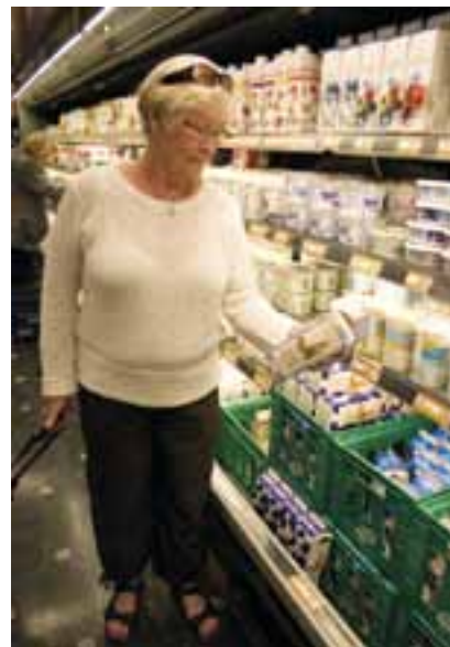
Forbrugerne vil fortsat have et skarpt øje på priserne i det nye år.

“Hvad ser bedst ud? En Netto-butik med Løgismose-produkter på hylderne eller en Føtex-butik med gule tilbudsskilte over det hele? Her klarer discounterne sig bedst,