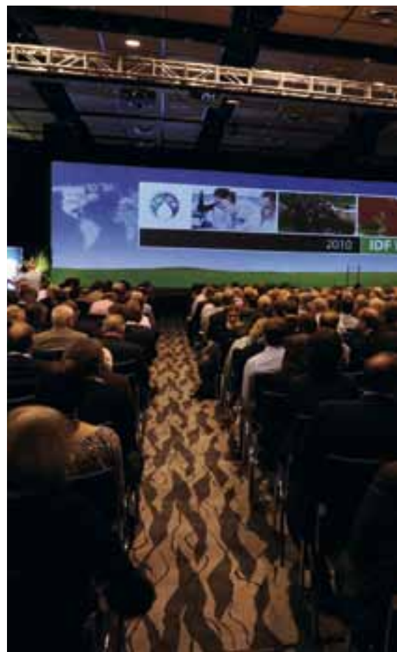
Årets World Dairy Summit i Auckland, New Zealand samlede folk fra det levans for mejeribranchen. I alt deltog 2.200 delegerede fra 66 lande.

Grønbog om mejeriindustriens initiativer på klimaområdet: www.dairy-sustainability-initiative.org