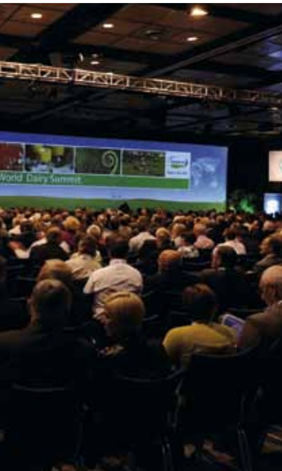
meste af verden til en lang række af seminarer og konferencer med re-