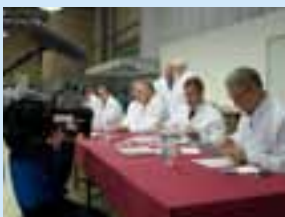
Reportageholdet fra Land TV i færd med at dokumentere finalestemmernes votering under den skandinaviske mejeridyst.

Land-tv har produceret en større reportage fra årets mejeriudstilling i Herning. Den bliver sendt på de regionale kanaler i perioden 3. - 9. dec. Find de regionale sendetidspunkter på hjemmesiden land-tv.dk. Her kan man også se udsendelsen direkte på nettet.