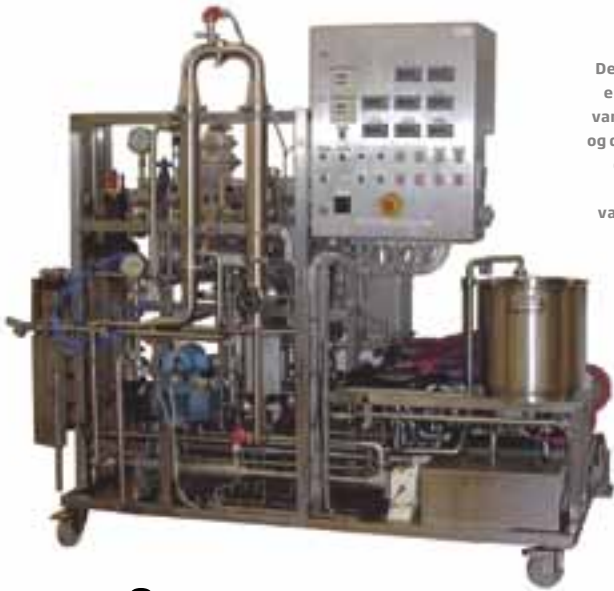
Det teknologiske setup til Lenient Steam Injection (LSI), hvor vanddamp blæses ind i mælken, og derefter afkøles ved en flashdestillation. Mælken blandes med små dampdråber og opvarmning og nedkøling kan ske på under 1 sekund.