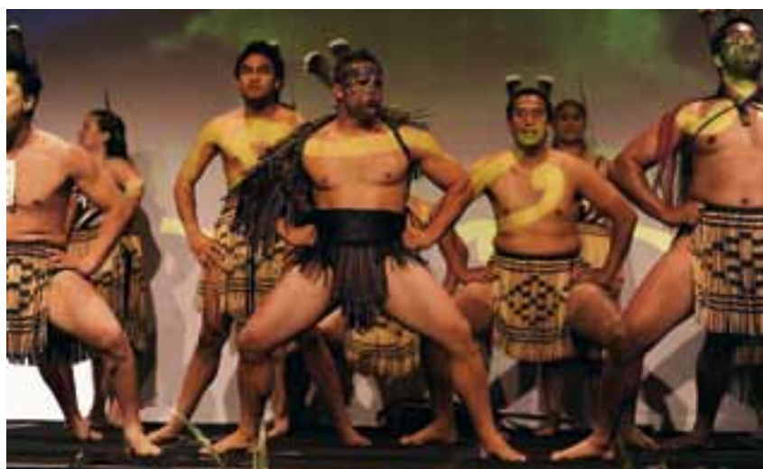
Sammenhold. En gruppe maoirer underholdt på scenen, da World Dairy Summit åbnede i Auckland, New Zealand den 8. november.

Men der var naturligvis mange andre interessante og vigtige emner på årsmødets dagsorden. I dette tema giver en række af de danske delegerede et indblik i, hvad der foregik på et udvalg af konferencerne: Politik og økonomi, miljø, osteteknologi, mejerividen- skab og ernæring.